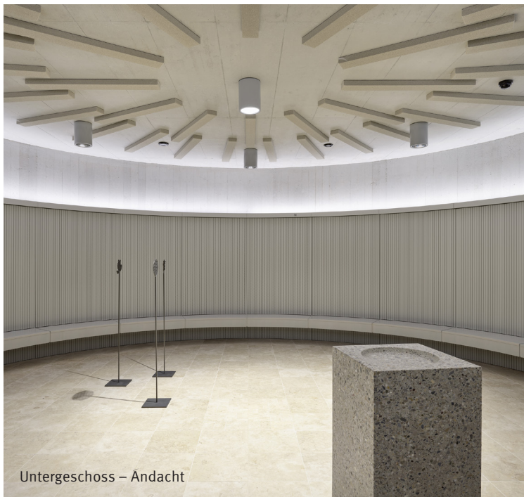
Untergeschoss – Andacht

Unternehmer Estermann Gipserunternehmen AG, Zofingen