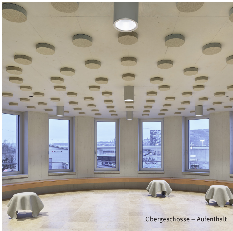
Obergeschosse – Aufenthalt