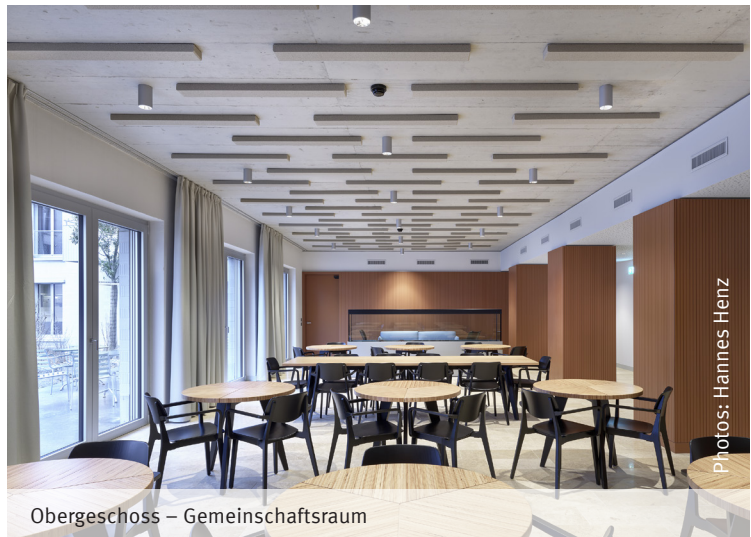
Obergeschoss – Gemeinschaftsraum