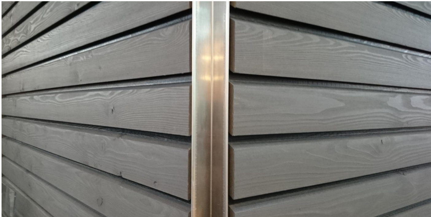
Saubere gerade Kante der Holzfassade mit Kantenprofil Nr. 9428 / Nr 9431.