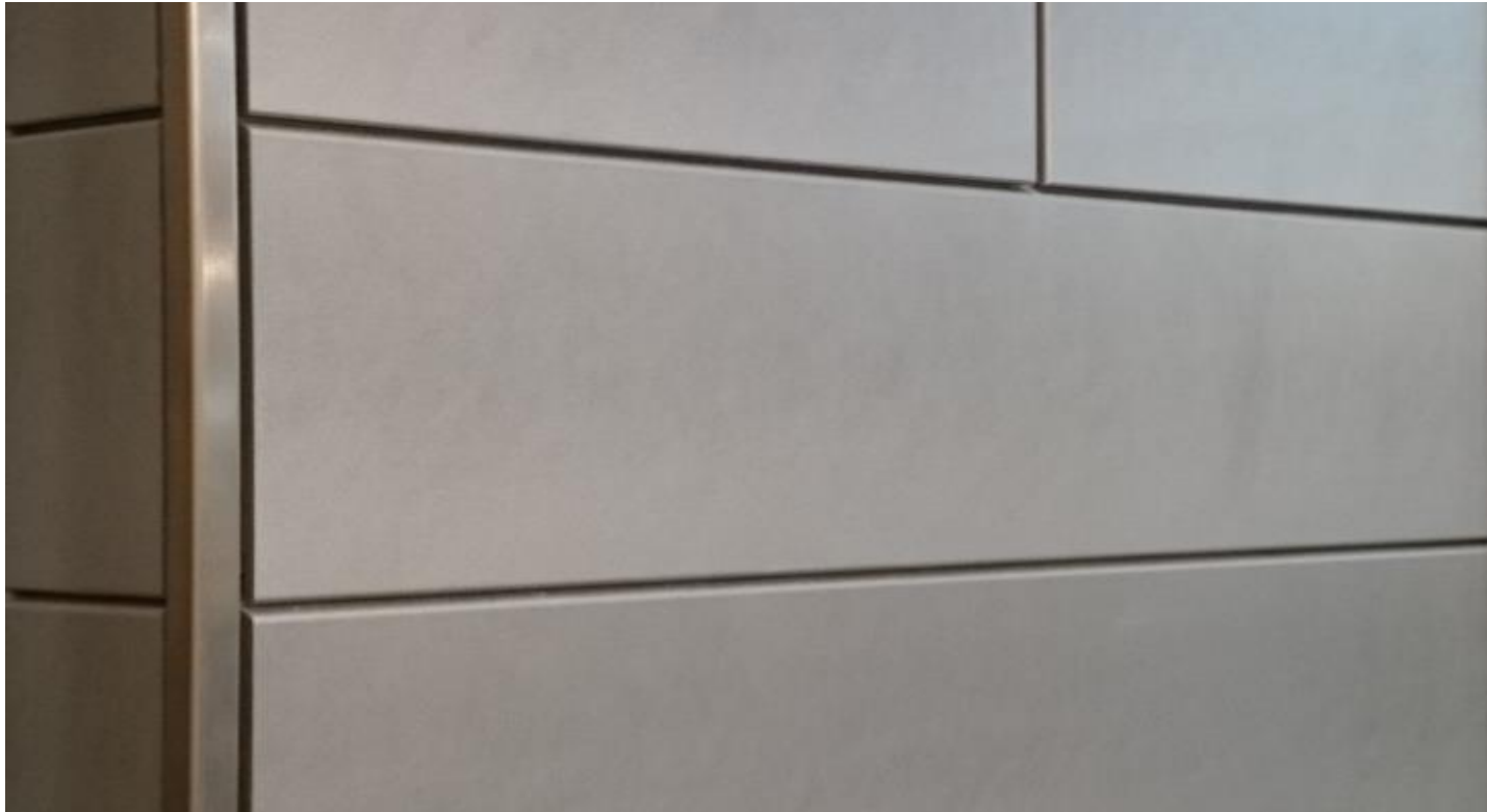
Saubere gerade Kante der Holzfassade mit Kantenprofil Nr. 9402/ Nr 9484.