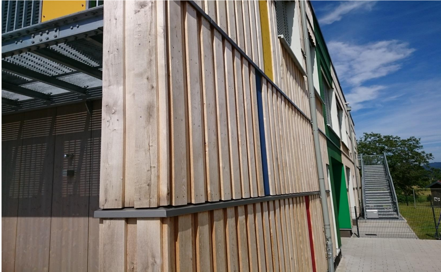
Horizontale Gliederung mit Sockelprofil Nr. 9083 mit Breite 60 mm.