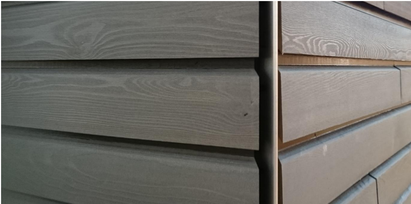
Saubere gerade Kante der Holzfassade mit Kantenprofil Nr. 9439/ Nr 9438.