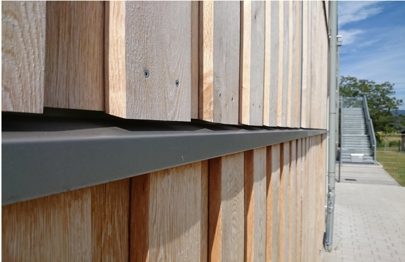
Horizontale Gliederung mit Sockelprofil Nr. 9083 mit Breite 60 mm.