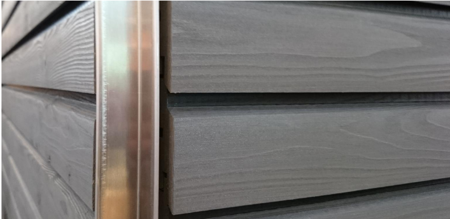
Saubere gerade Kante der Holzfassade mit Kantenprofil Nr. 9428 / Nr 9431.