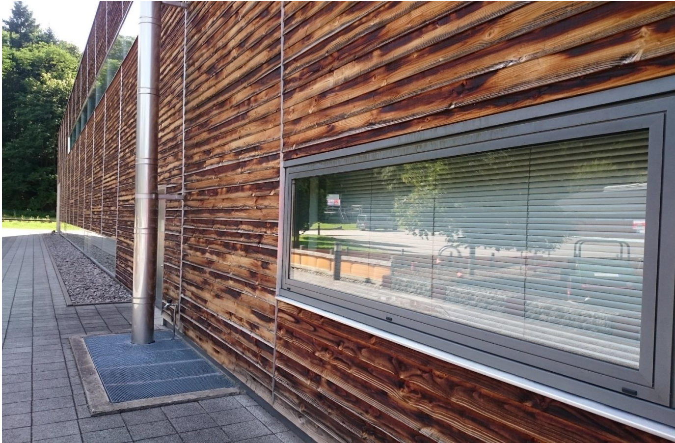
Vertikale Gliederung der Holzfassade durch Lisenenprofilen Nr. 9026 oder Nr. 9027.