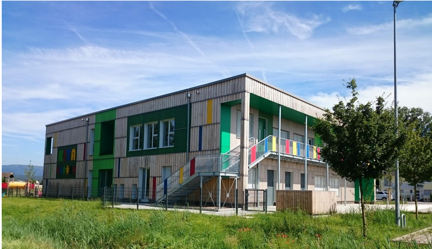
Horizontale Gliederung der Boden- Deckelschalung.