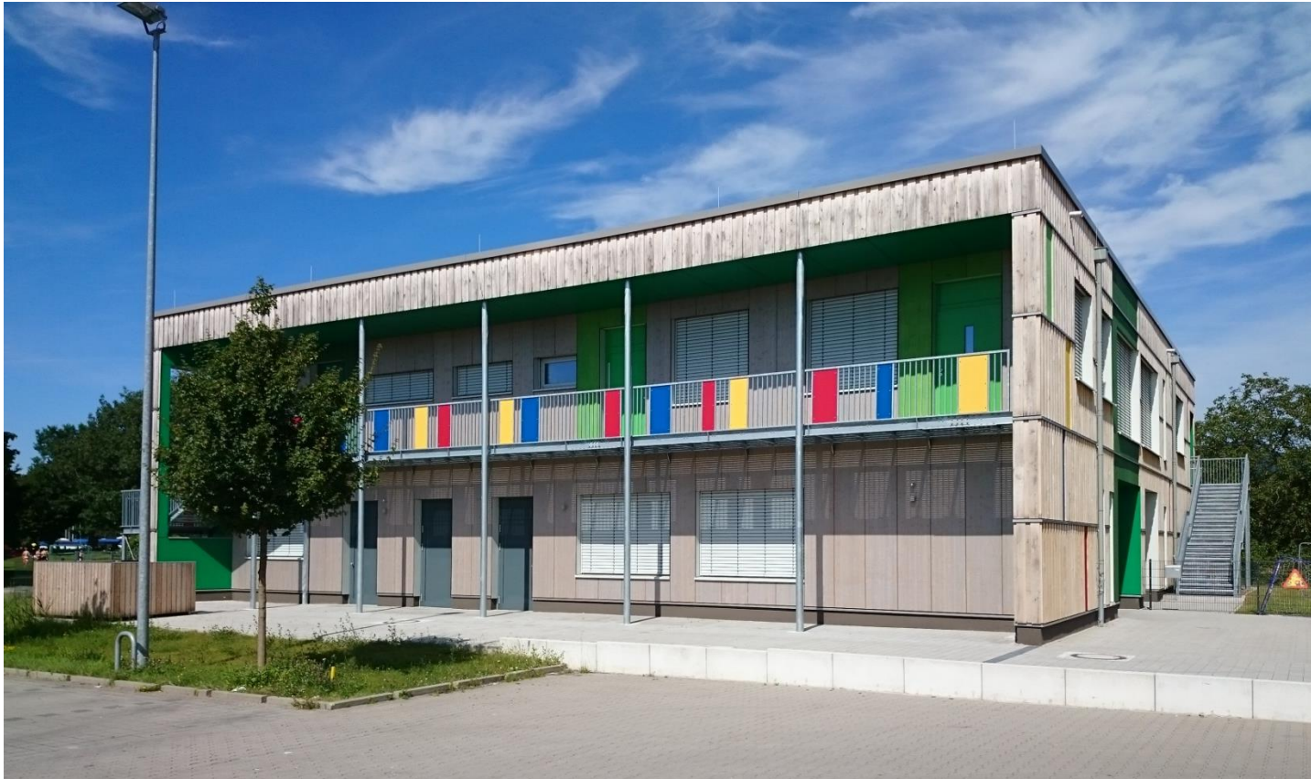
Horizontale Gliederung der Boden-Deckelschalung.